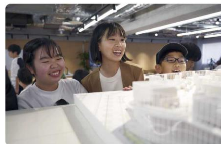
模型に目を輝かせる子供たち