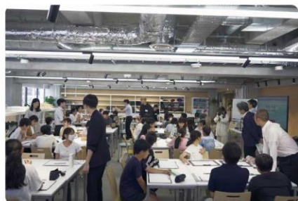
教室となる「工房」はこんな場所