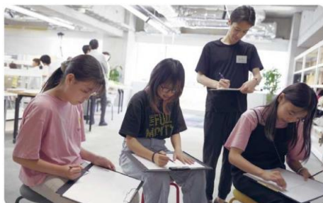
思い思いの場所を選んでパス描く