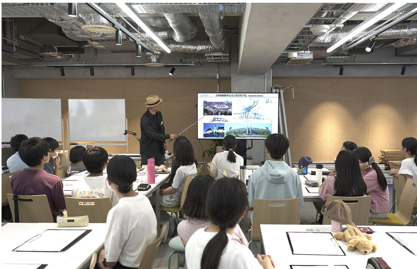
（写真はプレ講座の様子）

株式会社類設計室の教育事業部は、小学4年生～中学3年生を対象に、建築を学ぶ「こども建築塾」を新たに開講します（9月9日開講）。その受講生の募集を8月5日から開始します。こども建築塾は、教育事業部がこのほど新しく設立した「仕事学舎」の講座の一つ、ものづくり・デザインコースとなります。