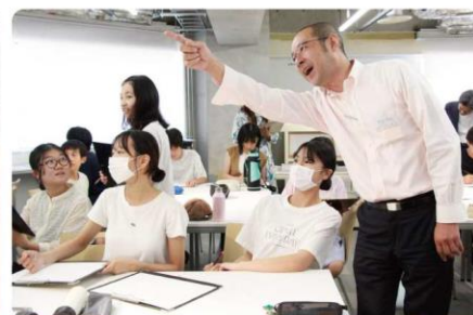
第一線で活躍する現役プロ建築士から、直接教わる