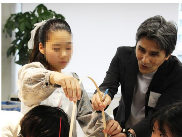
講師からアドバイスをもらってさらに真剣