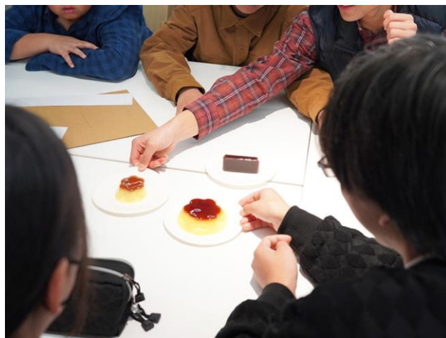
地盤の固さをプリンと羊羹にみたとて揺れの違いを確認