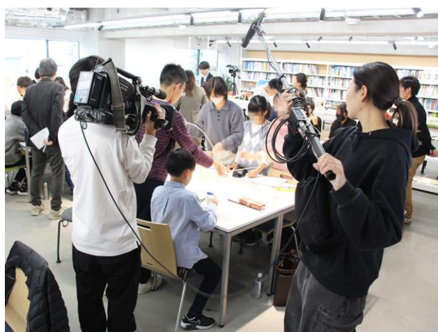
取材を受けていることを忘れるほど熱中