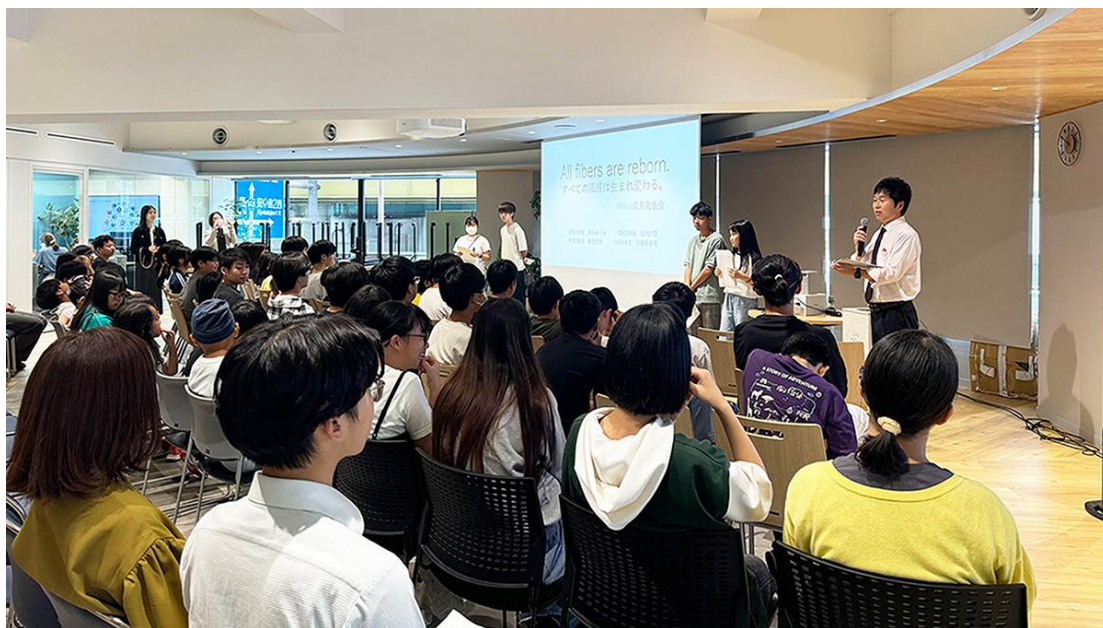
大勢の観覧者の前での最終学習成果発表会。モニターを横に4人の生徒がプレゼンに臨みました

その最終講座にあたる成果発表会を9月27日、弊社2階ホールで開催しました。発表した子どもたち（小学5年生から高3生までの4人）は約80人の聴衆の前で、繊維の回収・再生に関する探究学習の成果と今後取り組むアイデアをプレゼンテーションしました。