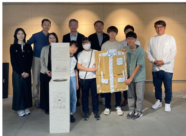
取材を受ける生徒たち（左）。ヤギ社とアミアズ社の皆さんと記念写真

4カ月にわたる探究学習に臨んだ子どもたちは、普段何気なく使っていた衣服が持つ大きな課題に気付きました。それは単なる知識としてではなく、繊維業界の最前線で働くヤギ