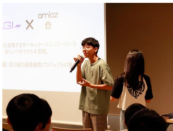
入念に準備した自作のパワーポイント資料でプレゼン。よどみなく進行しました

会場から感心の声が上がったのは、8月に開催されたワークショップの成果物を発表した時。その講座では、アミアズ社さんが持って来てくれた古着をチームで解体し、素材ごとに分別しました。その分別したシャツをそのシャツの元の形にして台紙に貼り付けたのです。「再生しようと思ったら、シャツ1枚でもこれだけ細かく分別されるんです」。インパクトがあり、非常に分かりやすく、観覧の皆さんの関心を捉えたようです。